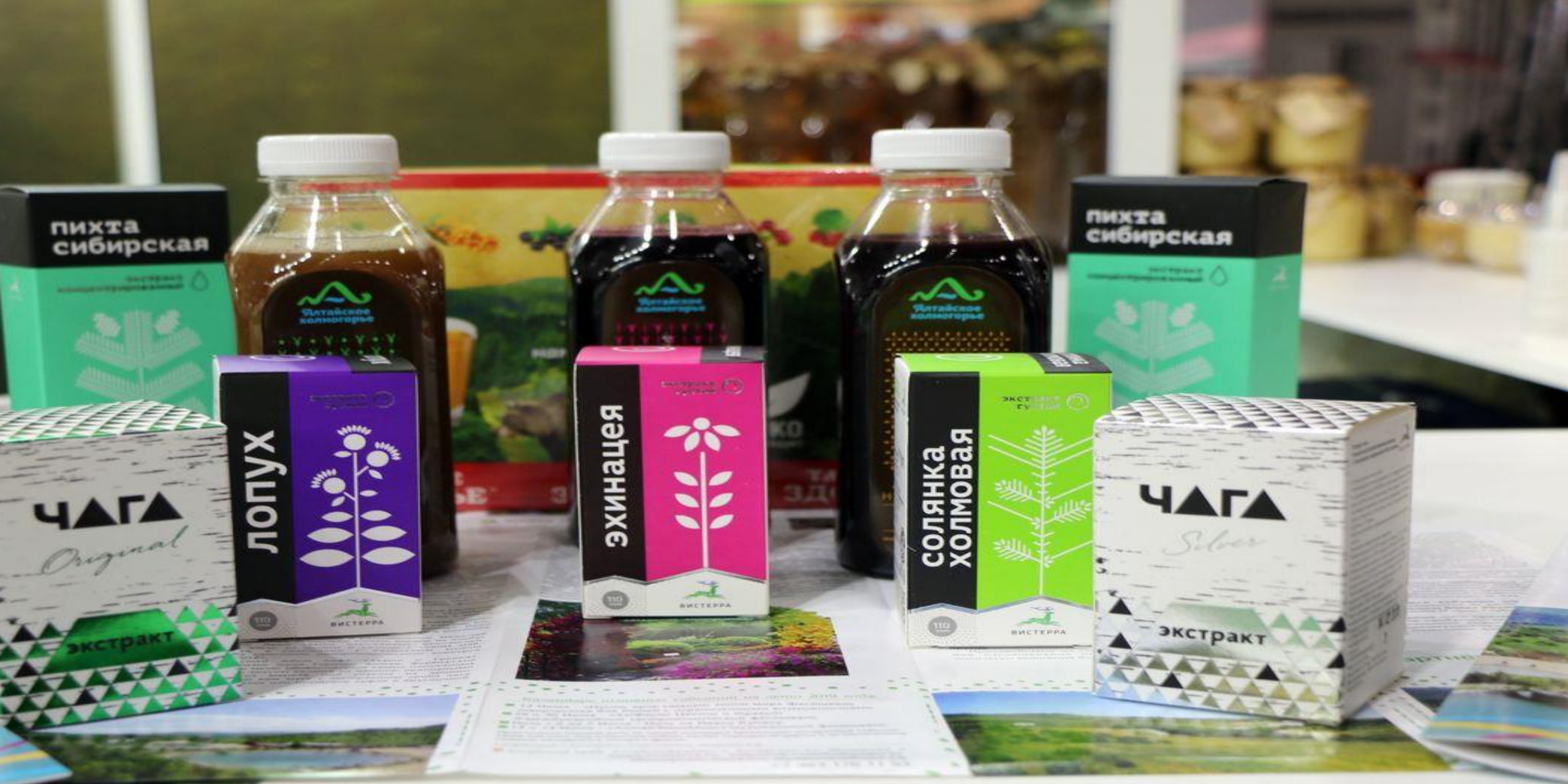
ЛАВКА ОЗДОРОВИТЕЛЬНОЙ ПРОДУКЦИИ